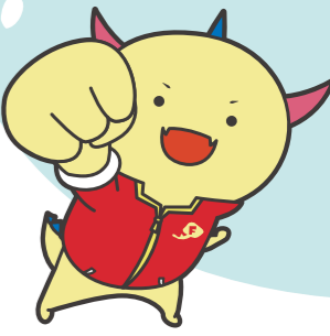
福井県マスコットキャラクター はびりゅう